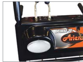
Halogenscheinwerfer: Sicheres Arbeiten auch bei Dunkelheit