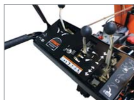
Benutzerfreundliche Anordnung der Bedienelemente