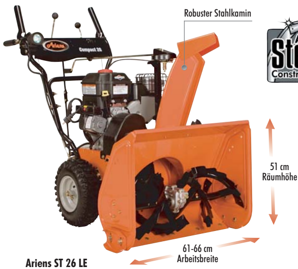
Ariens ST 26 LE