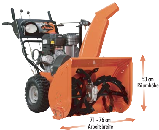
Ariens ST 28 DLE