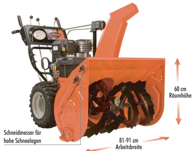
Ariens ST 32 DLE