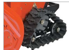
Breite und griffige Raupen