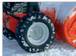
Automatische Differentialsperre für mehr Komfort und beste Traktion (DLE-Modelle)