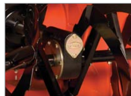
Das besonders robuste Fräsgetriebegehäuse aus Guss