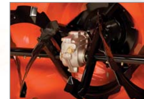
Robustes Fräsgetriebegehäuse aus Aluminium