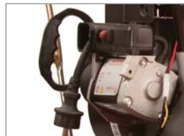
230 V E-Start für einfaches und leichtes Starten