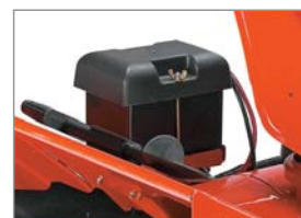
Mit dem 12 V E-Start können Sie die Fräse überall bequem starten (außer ST 11528)