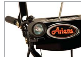
Arbeitsscheinwerfer (ST 26 LE)

Die hochwertige Ausführung der Ariens Fräsen mit robusten Stahlteilen garantiert eine hohe Lebensdauer