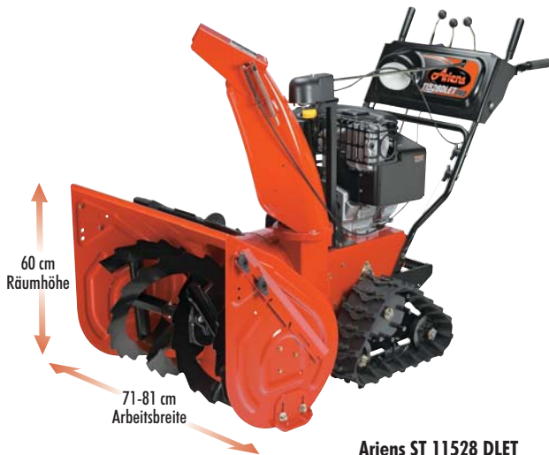
Ariens ST 11528 DLET

Die Professional Modelle erfüllen die hohen Anforderungen von Profis. Sie verfügen über Elektrostart, automatische Differentialsperre (DLE-Modelle) und Griffheizung für eine komfortable Bedienung. Ein noch stabileres Fräsgetriebe und der größere Fräskörper mit seitlichen Schneidmessern garantieren ein perfektes Räumergebnis.